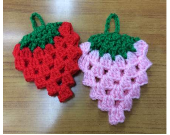
左は6/0号、右は7/0号で編んであります